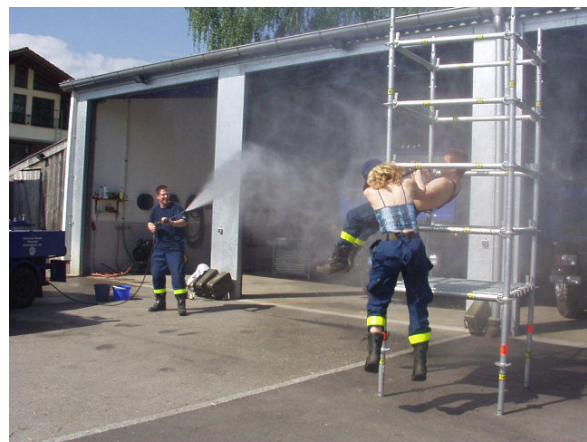
Erfolgreicher Ausbruch der Animateure nach Zufuhr temperaturregulierender Nebel. (Abb. Y / 4)